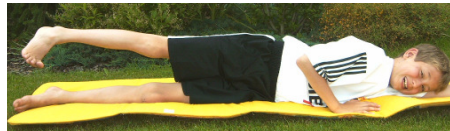
Kräftigungsübung Gesäß und Beinmuskulatur

Tipp: Bewegungsgeschichten und Fantasiereisen sollte man bei den Haltungsübungen einbauen, dann macht es noch mehr Spaß.